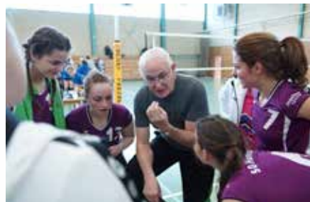
Der Volleyballguru mit seinen Mädels

hensachsen momentan auf dem 4. Tabellenplatz steht. Nach dem Aufstieg in die Bezirksliga ist es das Ziel Teams, sich am Ende der Saison auf dem 3.-4. Tabellenplatz zu halten und somit erfolgreich in der Liga zu bleiben.